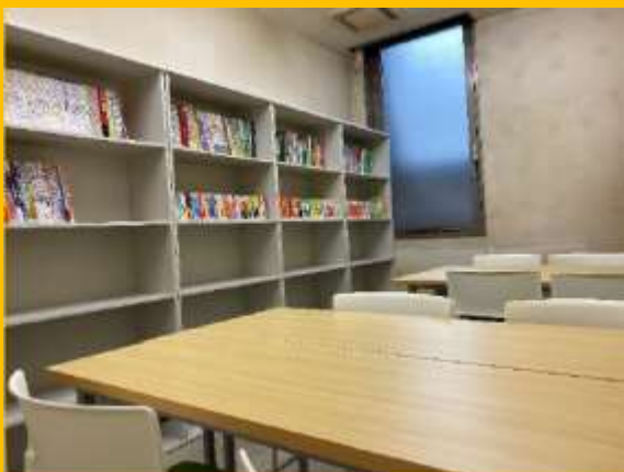
としょしつ しゃしん 図書室の写真

がつにゅうがく ねん 4月入学の2年コースがあり、入学時に N5 の資格取得レベルが求められます。