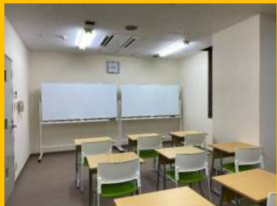
きょうしつ しゃしん 教室の写真